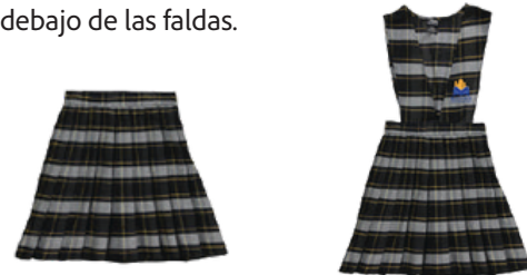
»» 1º a 5º grado