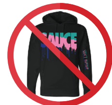
»» No hoodies