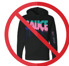
»» No hoodies

Must be navy blue. No hoodies. ONLY JACKETS WITH CITYSCAPE CREST MAY BE WORN DURING SCHOOL DAY.