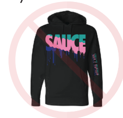
»» No hoodies