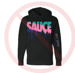
» No hoodies