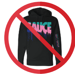
»» No hoodies