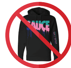
»» No hoodies