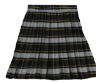
»» 1° a 5° grado