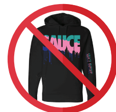
»» No hoodies